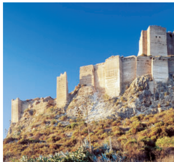
El castillo de Monteagudo constituyó un complejo palaciego fortificado construido por Ibn Mardannis.

La victoria frente a los cristianos en la batalla de Alarcos (1195) permitió a los almohades el traslado de la frontera del Guadiana al Tago. Los reyes cristianos derrotaron definitivamente a los almohades en las Navas de Tolosa (1212), lo que supuso la desintegración del poder almohade en los terceros reinos de Taifas.